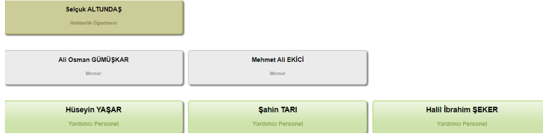
Şekil 1: Organizasyon Şeması